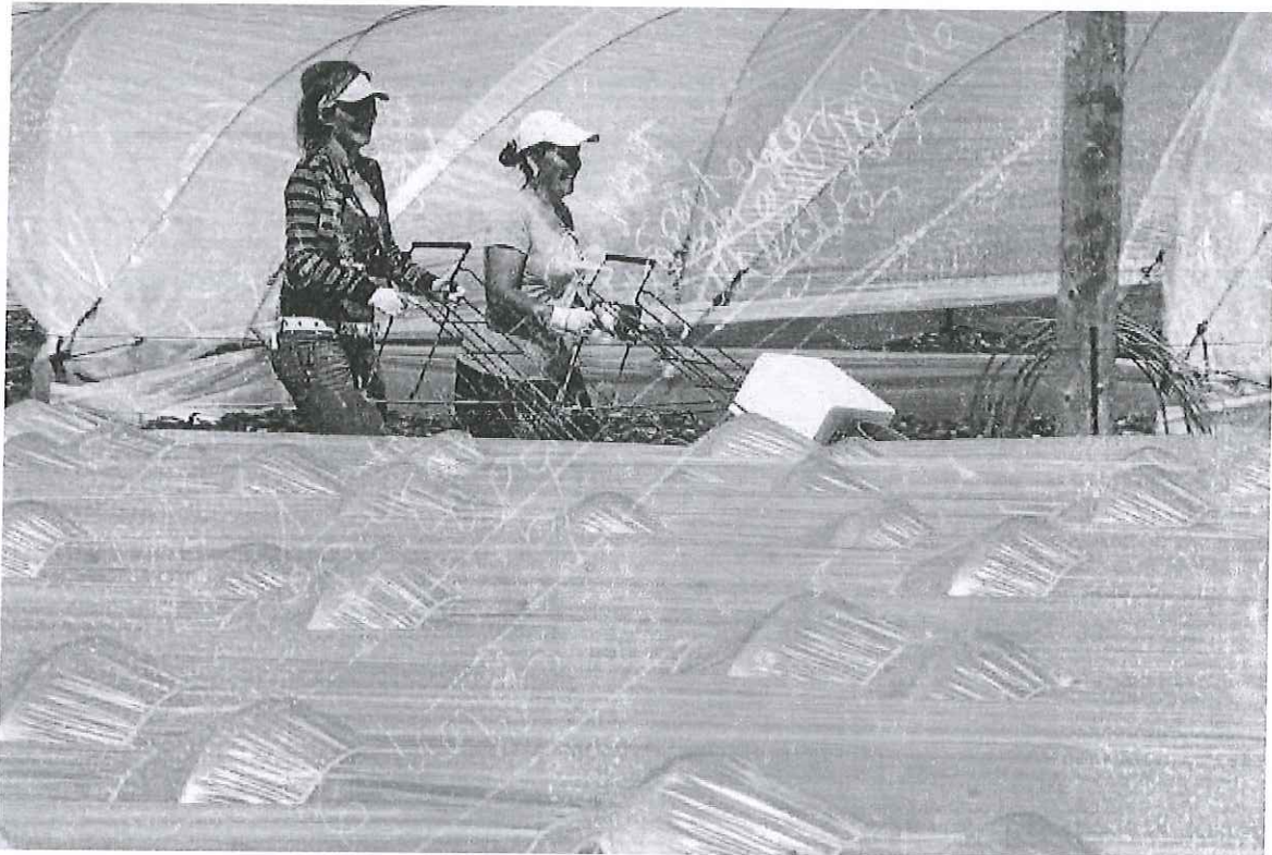
Dos temporeras extranjeras trabajando en una plantación de fresas en Palo, en Huelva.

CHEMA RODRÍGUEZ Sevilla 15 AGO. 2018 | 09:44